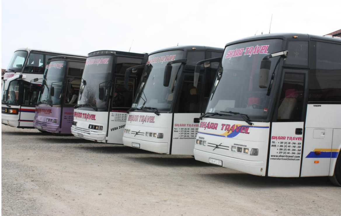
Perjeto kenaqesine me “Sharr Travel”